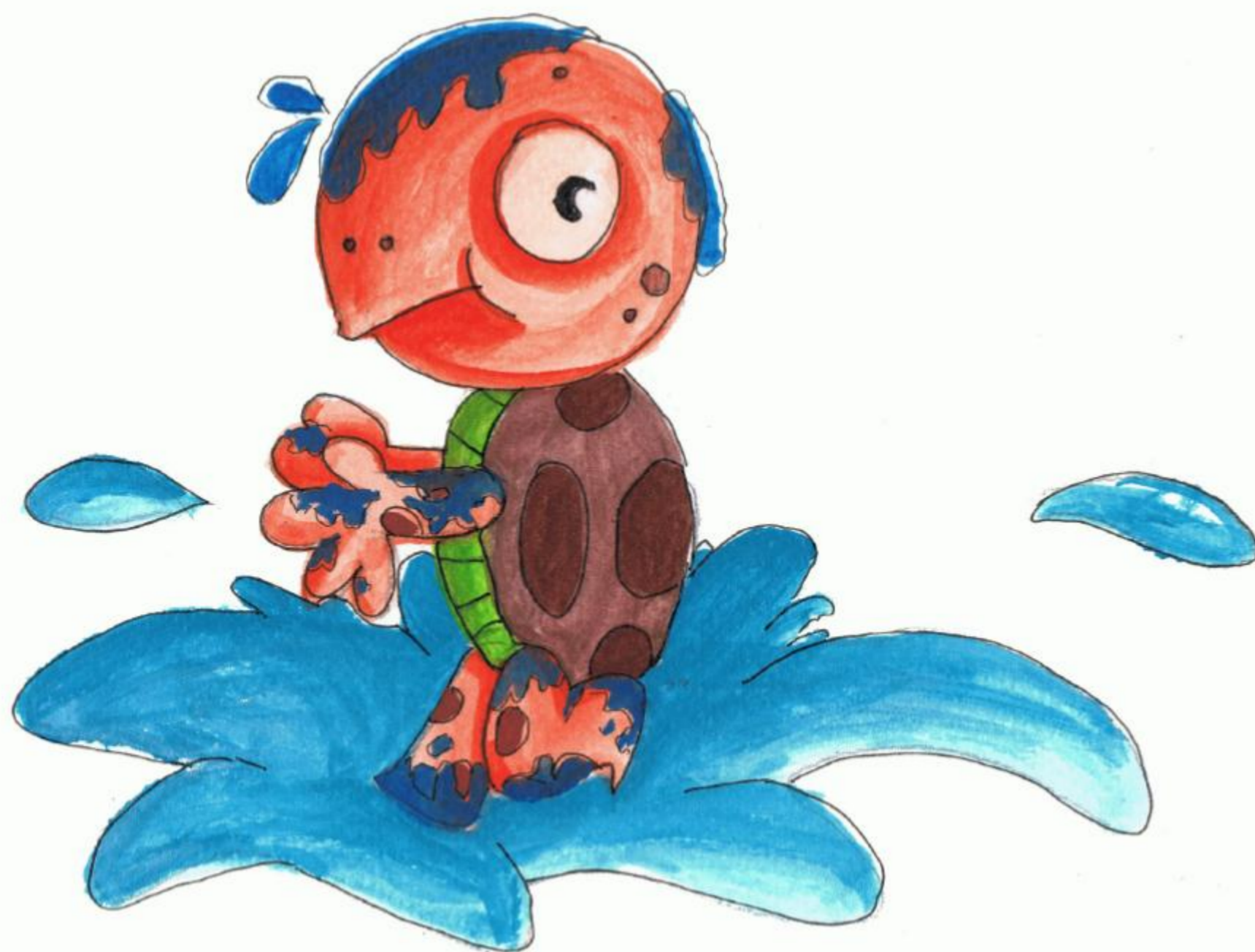
เจ้าเต่า ชอบเล่นโคลนเป็นพิเศษ

บริเวณหนองน้ำแห่งหนึ่ง ท้องฟ้าสดใส ยังมีปูนา กบ และเต่า กำลังเล่นกันอย่างสนุกสนาน จนเนื้อคัวมอมแมมไปตาม ๆ กัน หลังจากนั้น ปูนาและเจ้ากบก็จะกลับลงน้ำไป พอเช้าก็จะขึ้นมาเล่นด้วยกันใหม่ทุก ๆ วัน