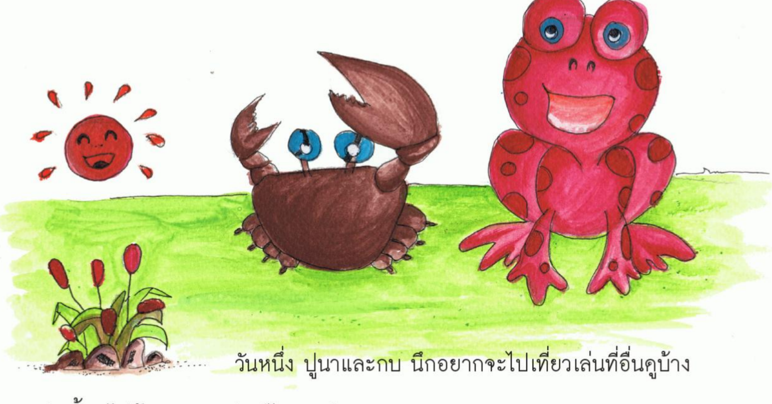
วันหนึ่ง ปูนาและกบ นึกอยากจะไปเที่ยวเล่นที่อื่นคูบ้าง

"วันนี้เราไปบ้านมดแดงกันดีไหม" ปูชวนกบ "ดีเหมือนกัน ฉันอยากไปเล่นที่อื่นคูบ้าง" กบตอบ "แต่เอ...ทำไมป่านนี้เจ้าเต่าถึงยังไม่มานะ" ปูนารำพึง "งั้นเรา รอเจ้าเต่าสักเดี๋ยวก่อนดีกว่า" กบพูดกับปูนา